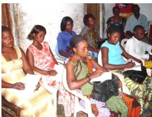
La formation des jeunes à la MAISON D'APPRENTISSAGE PROFESSIONNEL (MAP) A KIMPESE